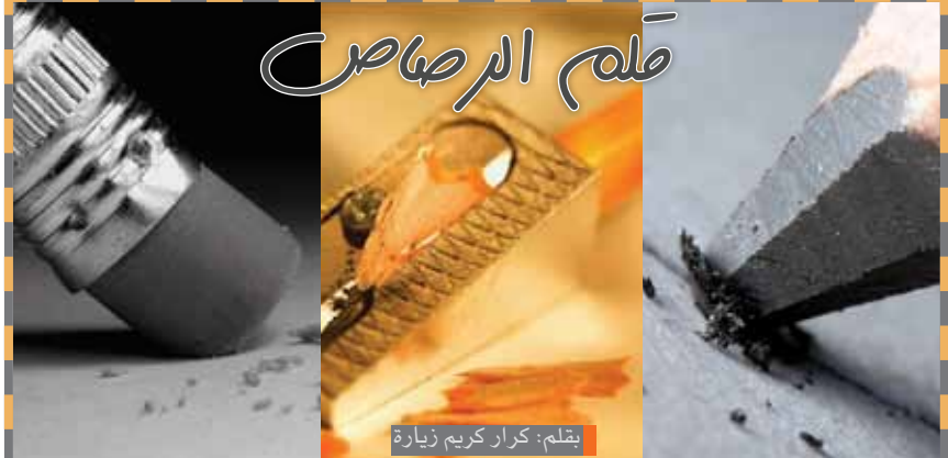
بقلم: كزار كريم زيارة

الشهر السرياني (التقويم الآرامي) حزيران لفظ سرياني يعني الحنطة أي القمح لوقوع موسم حصاده فيه.